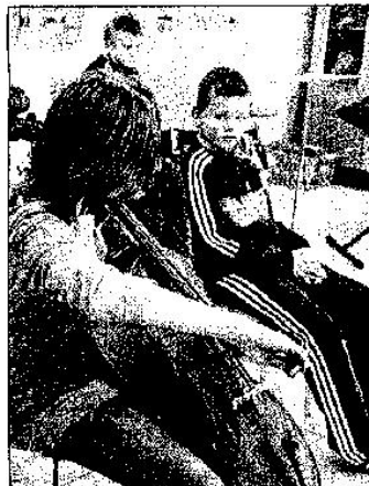
Les élèves, collégiens pour la plupart, ont joué

L'Orchestre de l'Estic répète tous les mardis, de 17 h à 18 h, à la salle de musique de l'établissement.