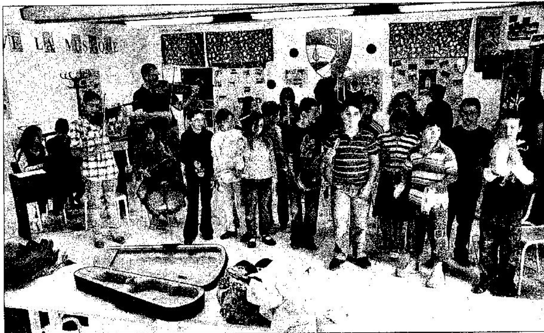
L'Orchestre de l'Estic compte une trentaine de membres.

Synthétiseur, batterie, congas, piano, violon, violon alto, violoncelle, saxophone, trompette,